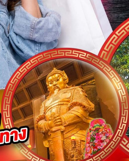
วัดเซกตง