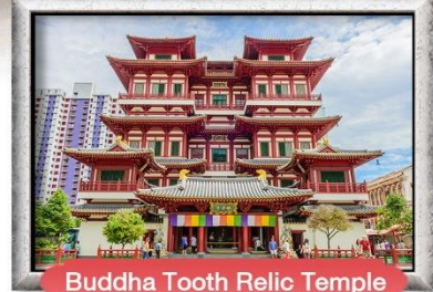
Buddha Tooth Relic Temple